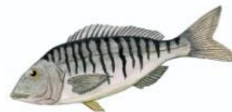
Marbré 20 cm ( Lithognathus mormyrus )