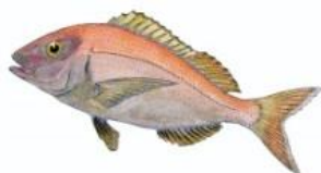
Pageot commun 15 cm ( Pagellus erythrinus )