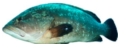
Mérou brun ( Epinephelus marginatus ) Fin moratoire 23/12/2023