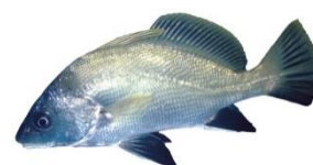
Corb ( Sciaena umbra ) Fin moratoire 20/12/2023