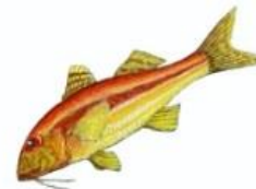
Rougets 15 cm ( Mullus sp. )