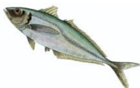
Chinchards 15 cm ( Trachurus sp. )